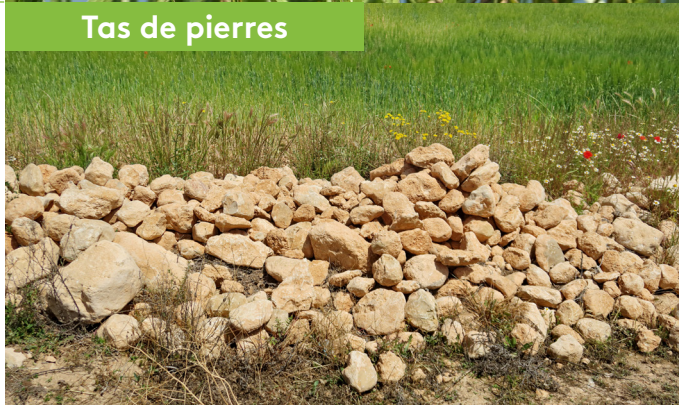
Tas de pierres