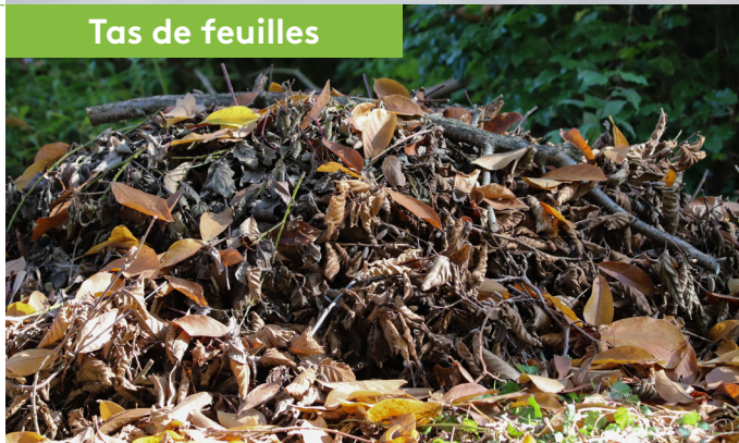
Tas de feuilles