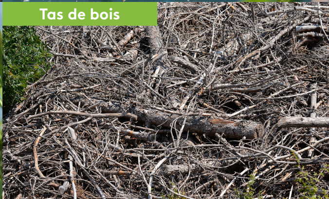
Tas de bois